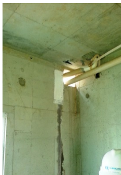
Fixação da Tela de Poliéster com o Baucryl VEDAFRISO

Centralize o tratamento a faixa de 10 cm.