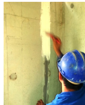
Junta centralizada no tratamento. Faixa com 10 cm.