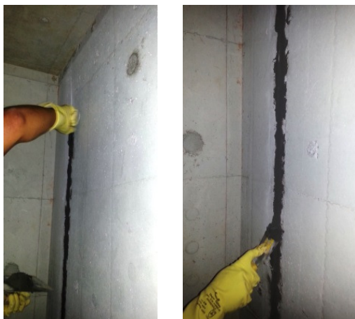
Acabamento do Selante

Aguardar 24 horas para aplicação da membrana elástica.