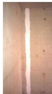
Aplicação da 2ª Demão e Acabado.